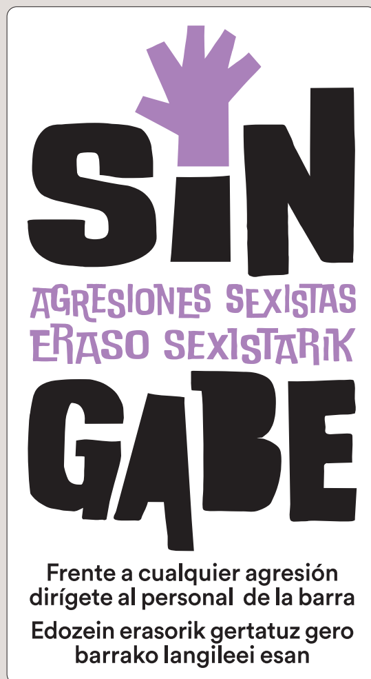
ADHESIVO PUERTAS 72 x 130 mm